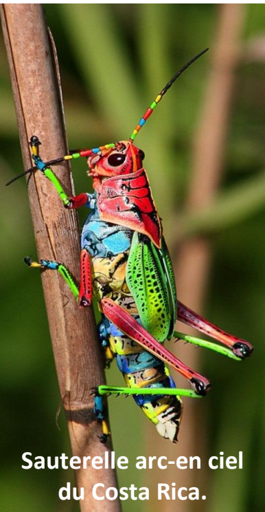
Sauterelle arc-en-ciel du Costa Rica.

Merci de votre écoute, mieux vaut aller dormir quelques millénaires, ça ira mieux après... J'espère !