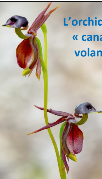
L'orchidée « canard volant »

Quand la bêtise humaine confie ses décisions à l'intelligence des robots, ils calculent logiquement qu'il faut éliminer la bêtise de l'opérateur qui l'empêche d'atteindre son objectif.